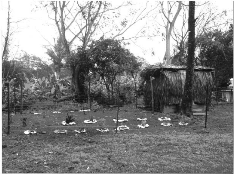
Jardín botánico de la Casa Comunitaria de la Mujer, a la derecha el baño ecológico