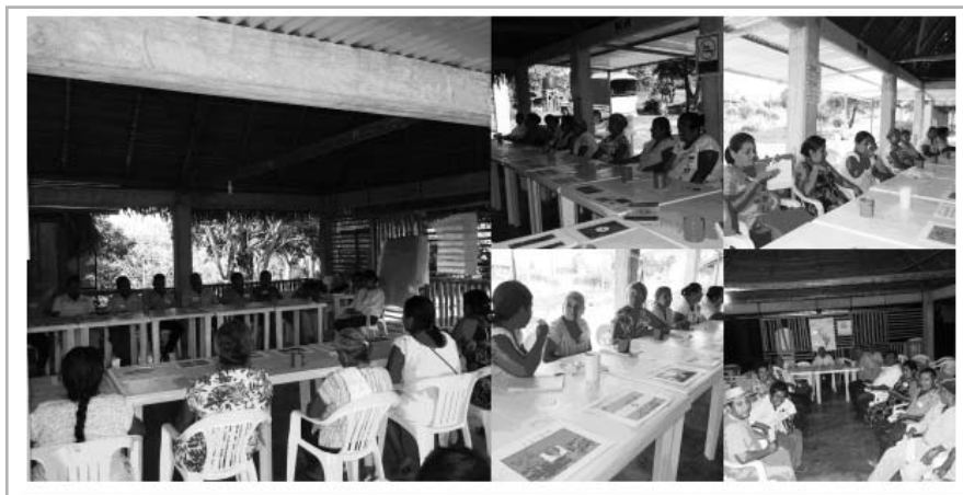
Taller de mujeres y hombres sobre el significado de acudir ante el Sistema Interamericano de Derechos Humanos