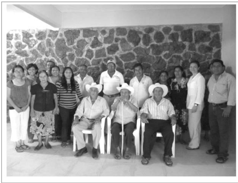
Mujeres en la reunión de consulta a autoridades y ancianos