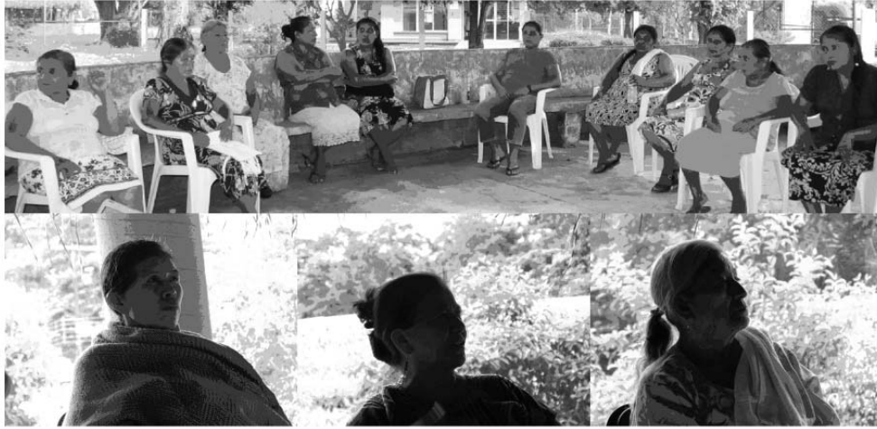
Mujeres de Jaltepec en taller bajo la sombra del Tamarindo