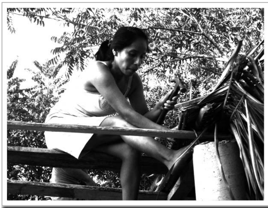
Mujer techando el baño ecológico