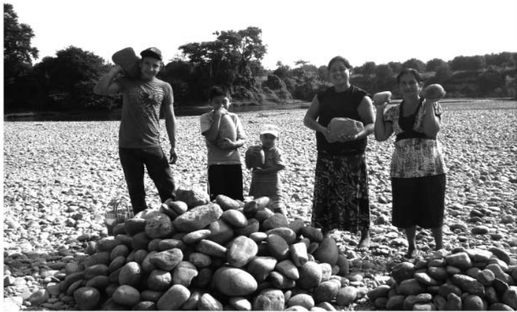
Mujeres con sus hijos juntando piedras para la construcción de la Casa Comunitaria de la Mujer