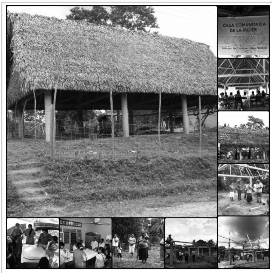
Proceso de construcción de la Casa Comunitaria de la Mujer