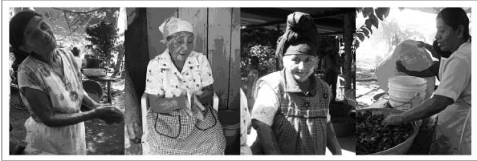
Mujeres preparando alimentos para la mayordomía del pueblo